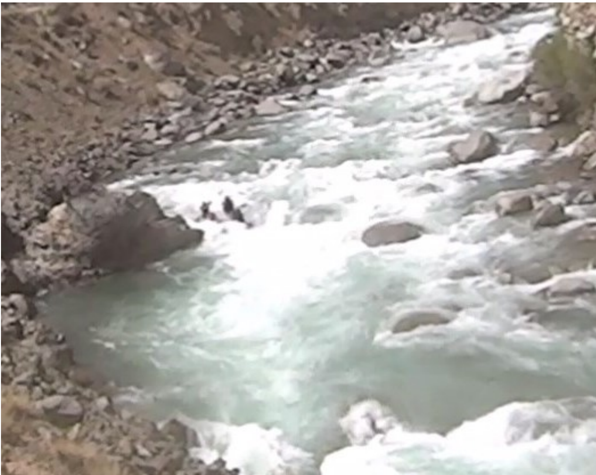
Кекемерен. Пор. Тура-Гоин 2. Прохождение кат-4 следующего слива на переднем плане.