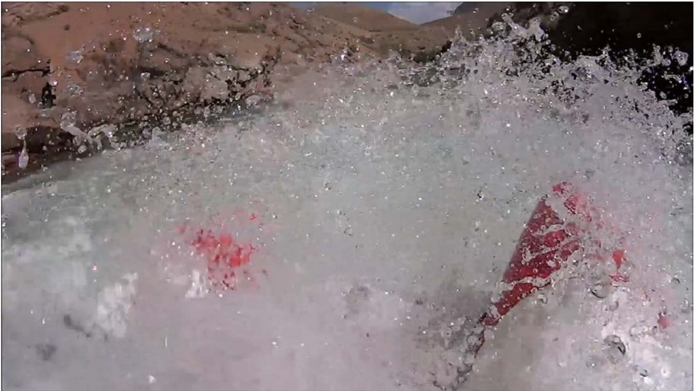
Кекемерен. Пор. Тура-Гоин 3. Кат-2/1 проходит сквозь «пенный вал» после слива на предыдущем фото.