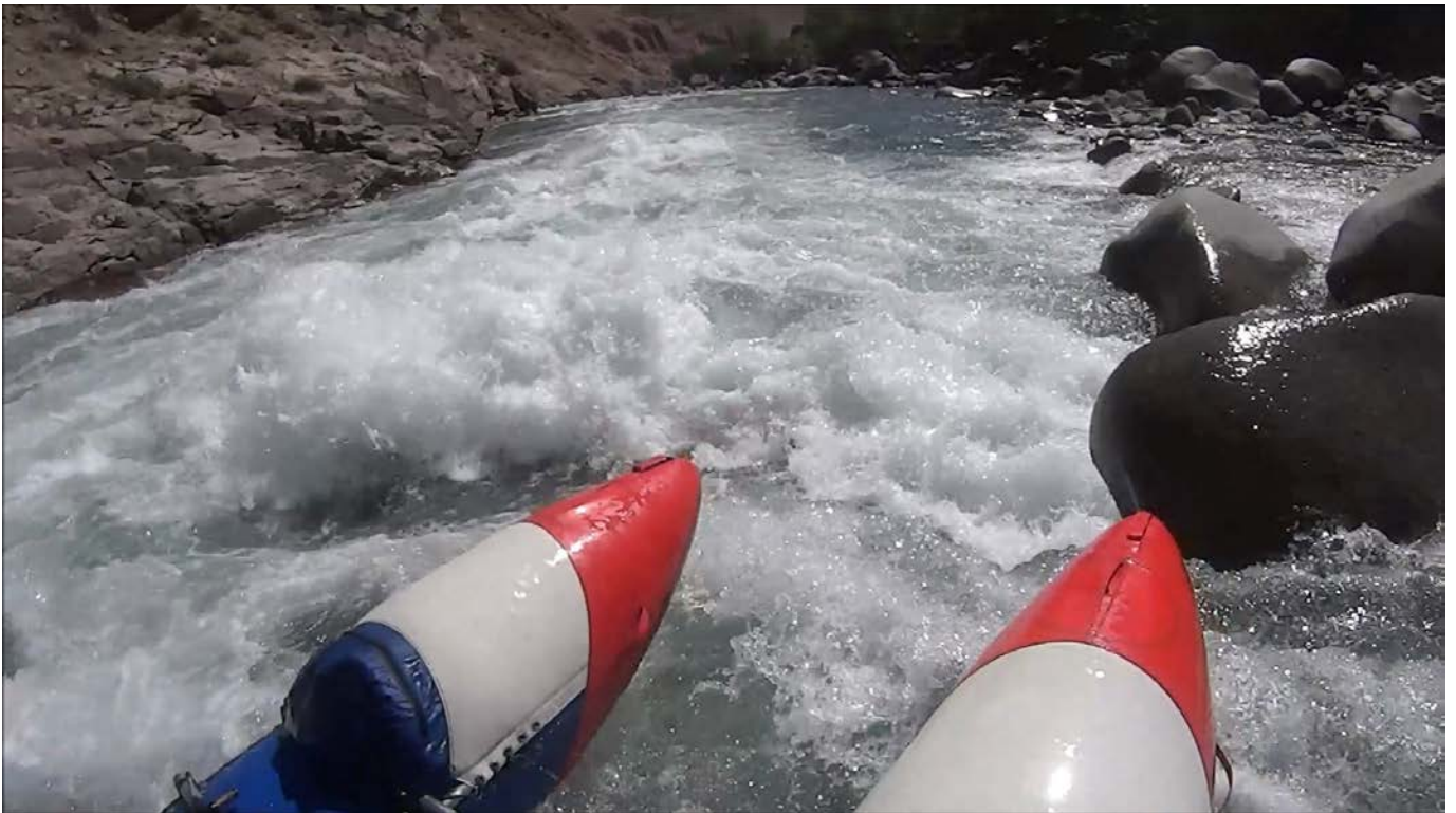
Кекемерен. Пор. Тура-Гоин 1. Кат-2/1. Заход в слив с последующей чалкой.