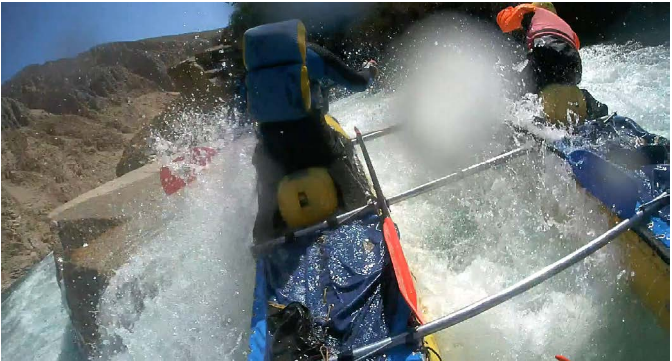
Кекемерен. Пор. Тура-Гоин 1. Кат-4 проходит вплотную к скале в центре струи.