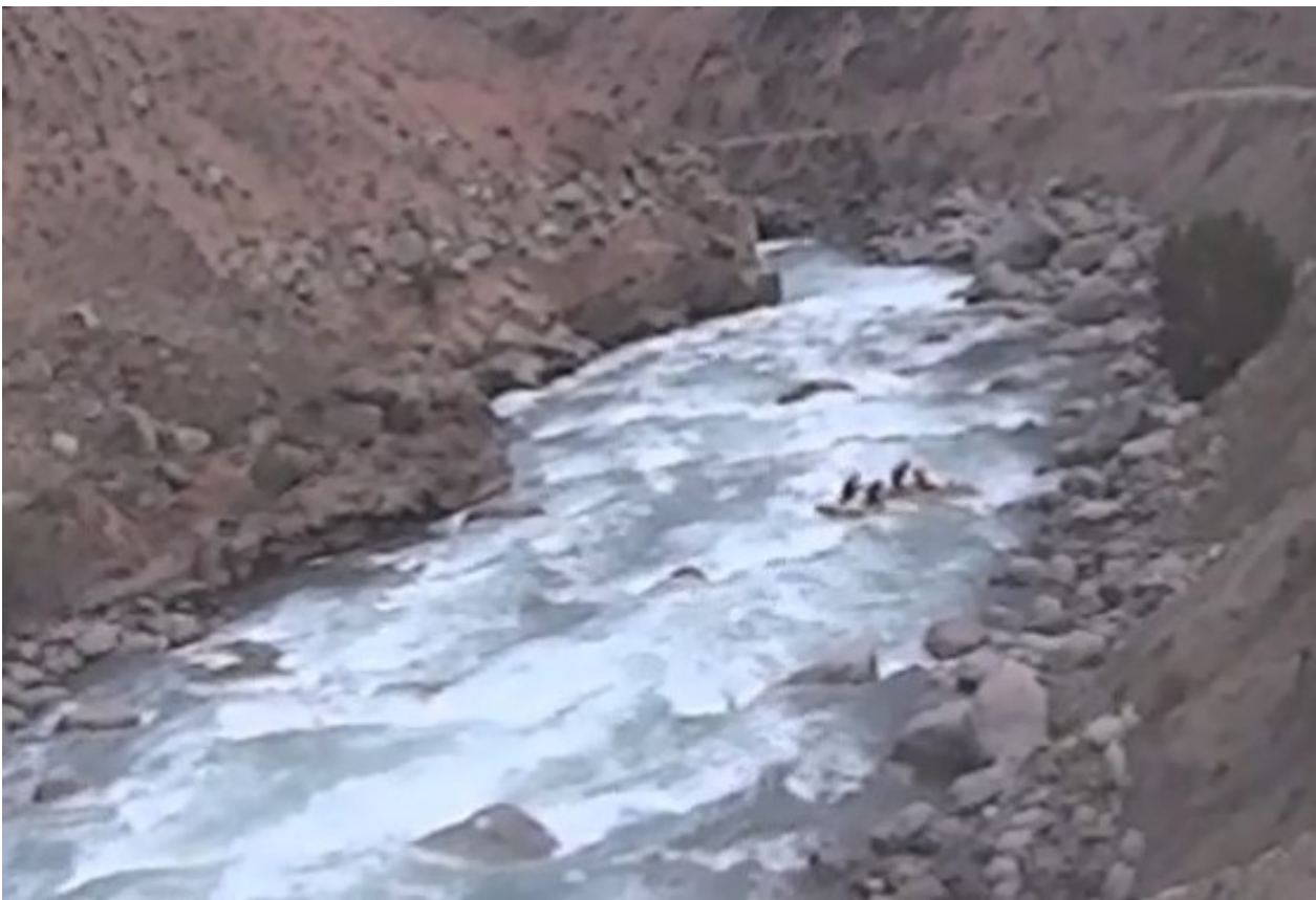
Кекемерен. Пор. Тура-Гоин 2. Кат-4. Панорама заключительной трети порога. Уход на отдых.