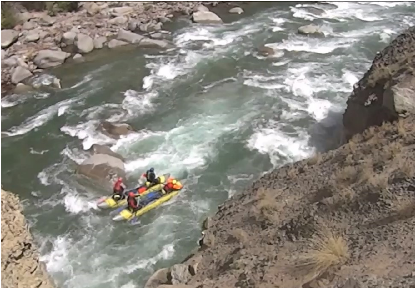
Кекемерен. Пор. Тура-Гоин 2. Кат-4 входит в заключительную треть порога.