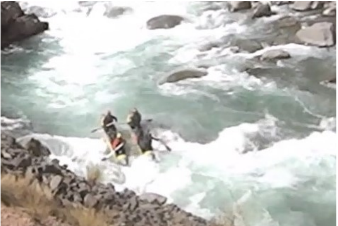
Кекемерен. Пор. Тура-Гоин 2. Прохождение кат-4.