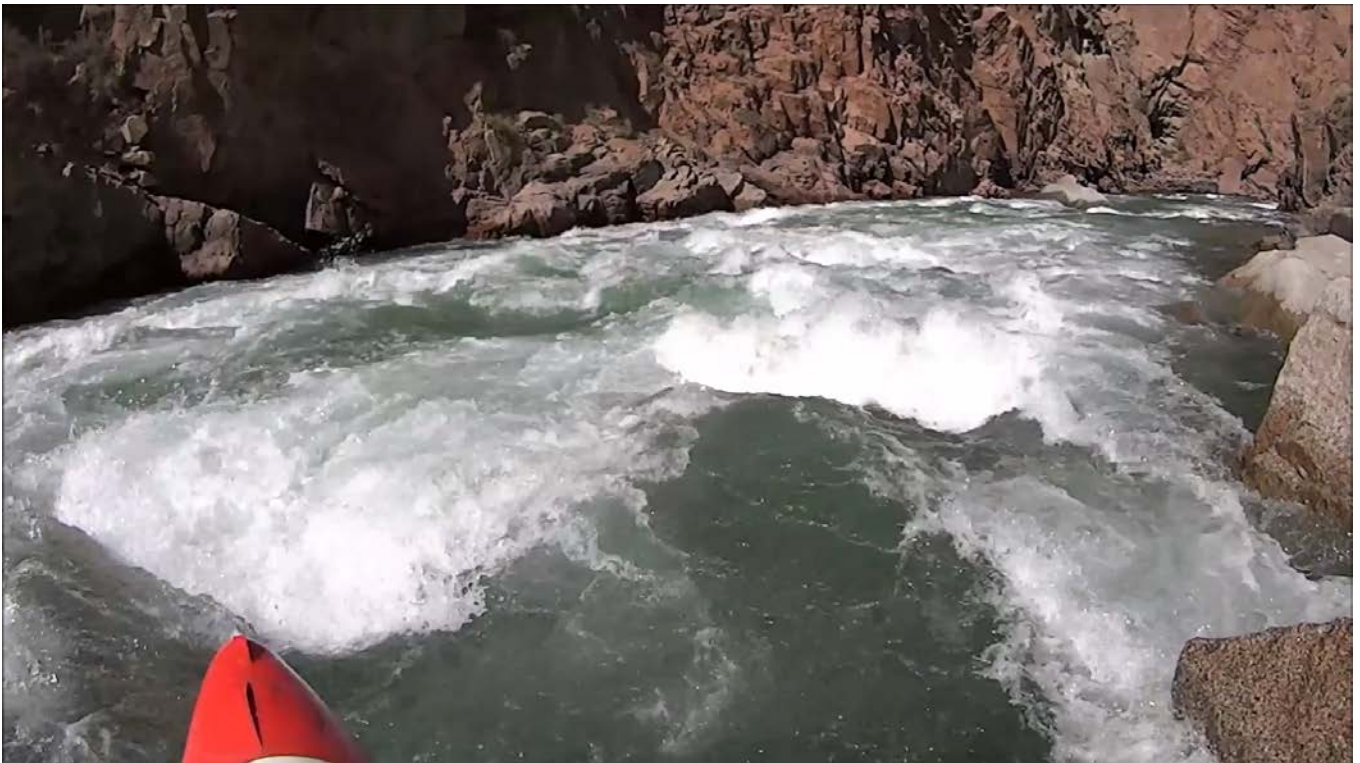
Кекемерен. Пор. Тура-Гоин 3. Кат-2/1 в сливах в конце прямого участка порога.