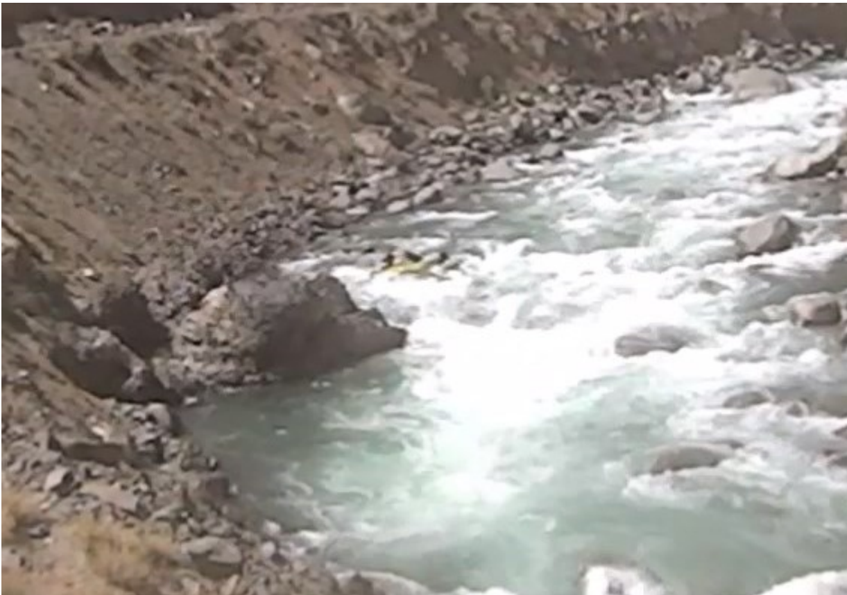
Кекемерен. Пор. Тура-Гоин 2. Прохождение кат-4 слива на переднем плане (стойка на задних концах баллонов).