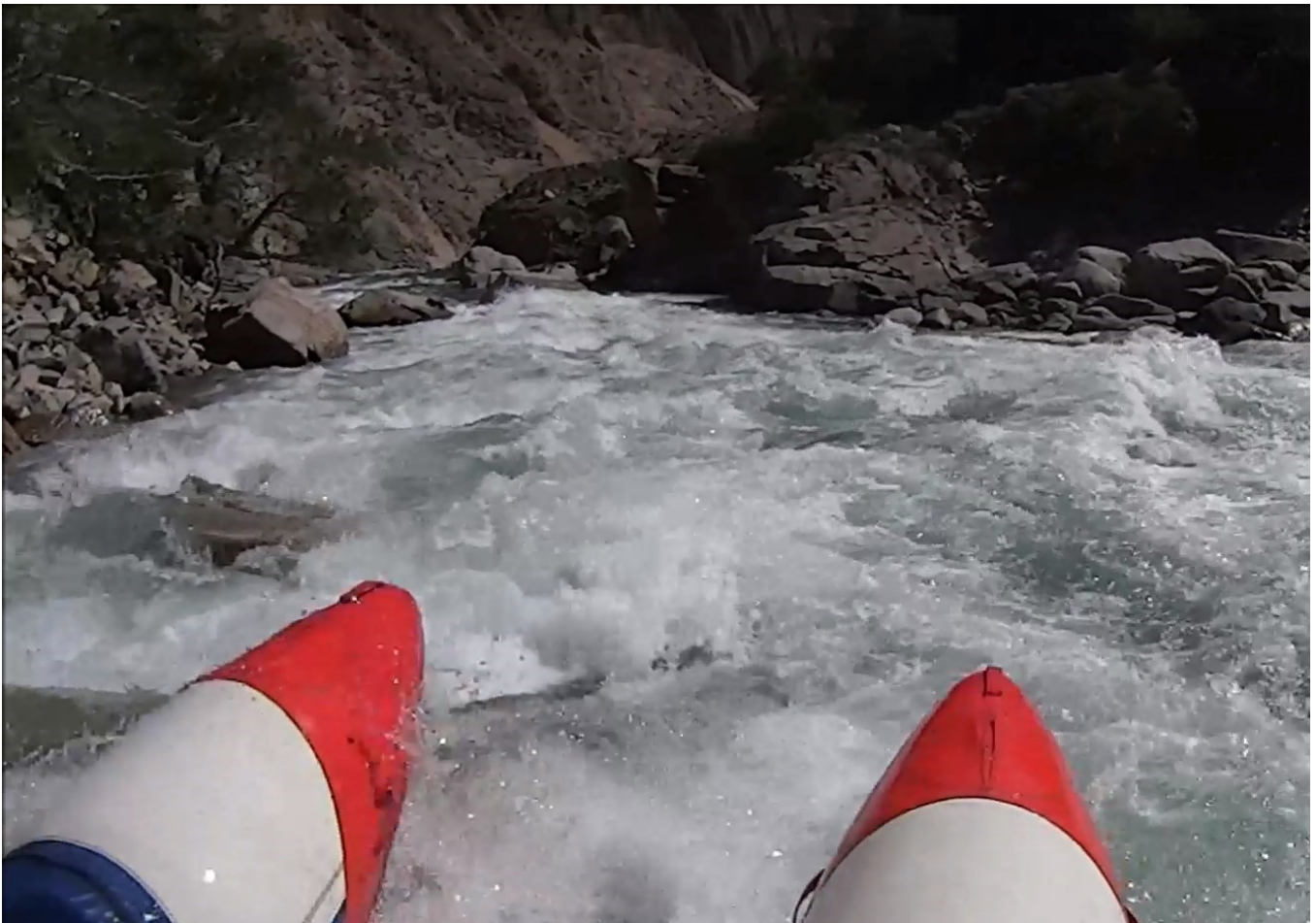
Кекемерен. Пор. Тура-Гоин 1. Кат-2/1. Заходная горка-шивера. Вдали видна скала в середине струи.