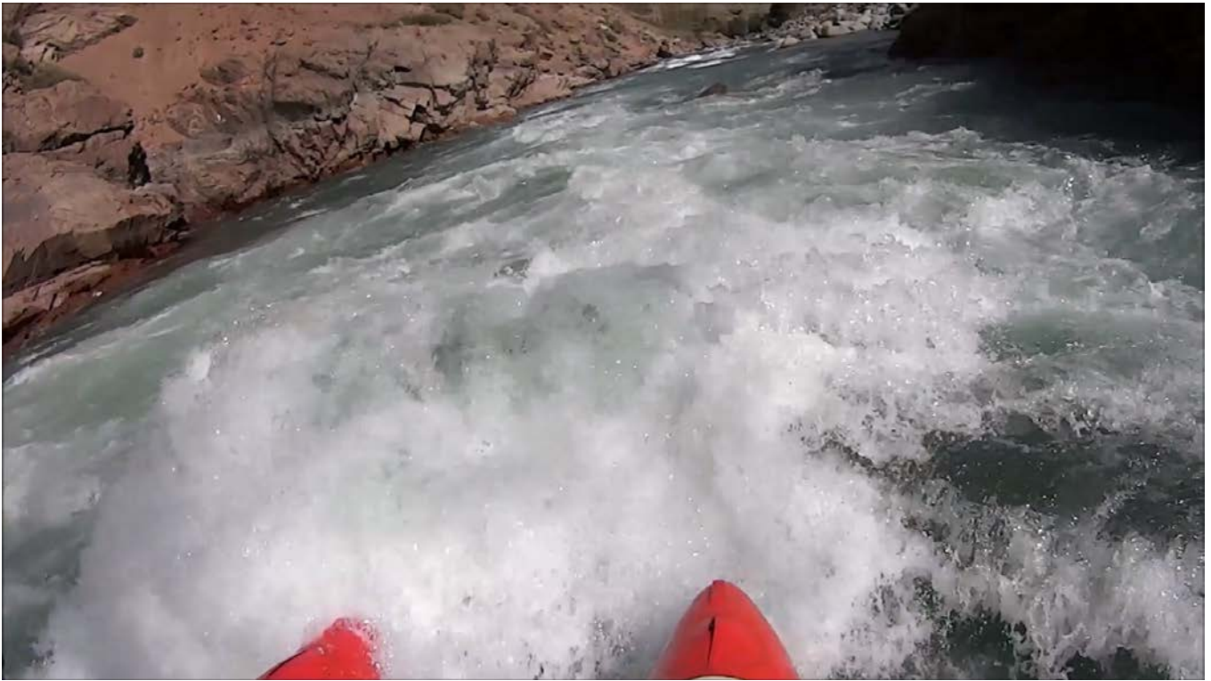
Кекемерен. Пор. Тура-Гоин 3. Кат-2/1 входит в мощный слив в середине порога.