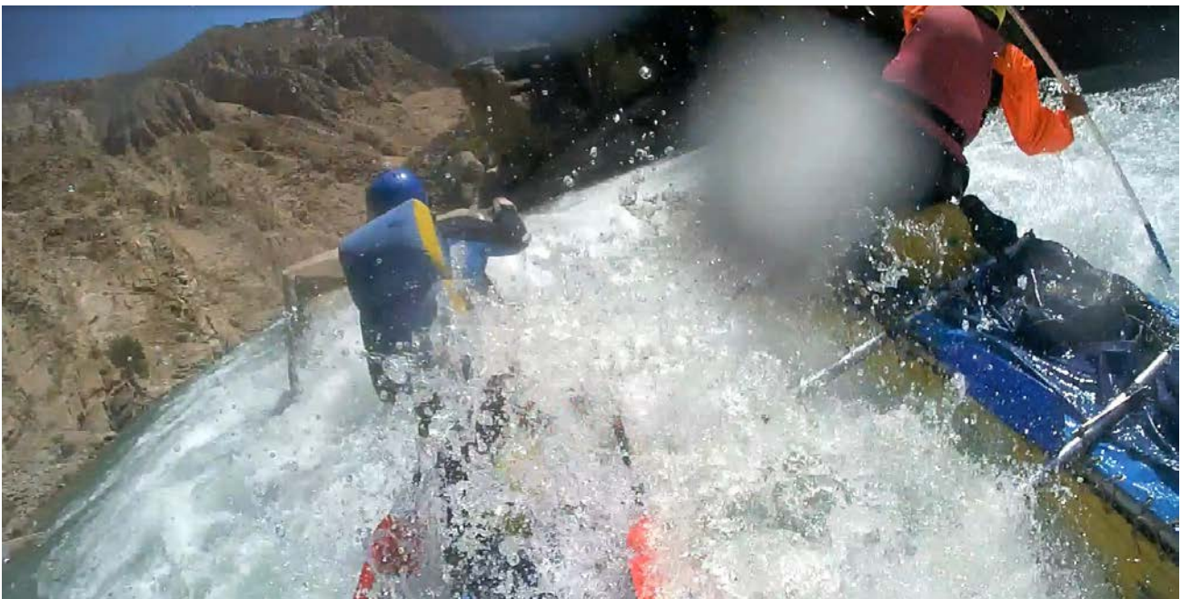
Кекемерен. Пор. Тура-Гоин 1. Кат-4 в сливах перед скалой в центре струи (прямо вперед).