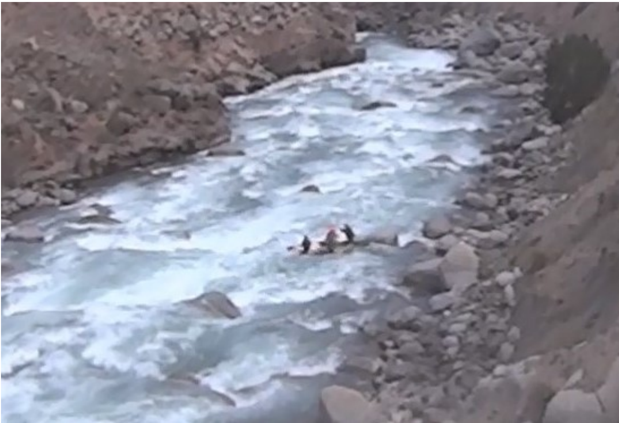
Кекемерен. Пор. Тура-Гоин 2. Кат-4. Панорама заключительной трети порога.