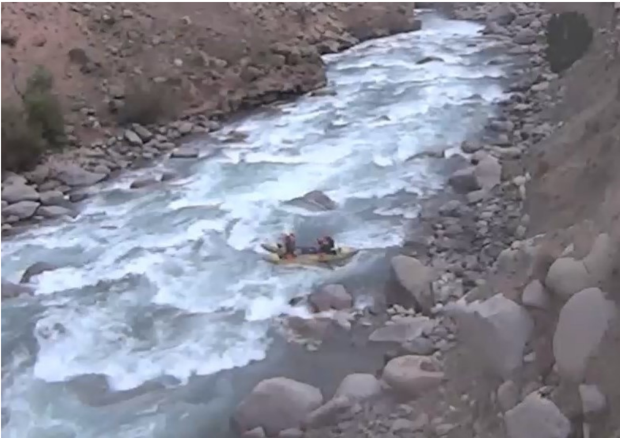
Кекемерен. Пор. Тура-Гоин 2. Кат-4 в заключительной трети порога. Отдых на валуне.