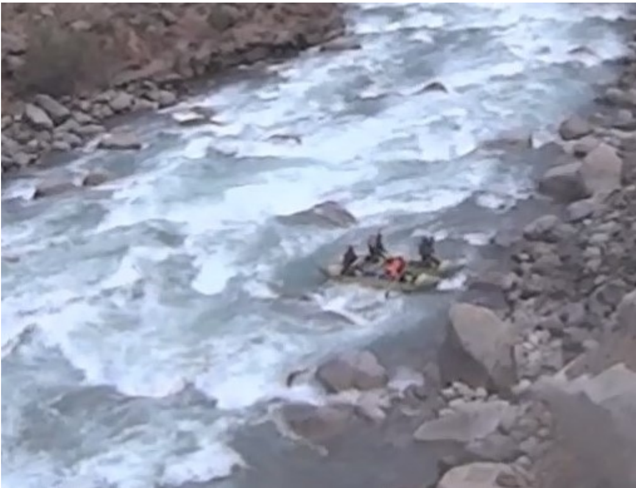
Кекемерен. Пор. Тура-Гоин 2. Кат-4 в заключительной трети порога. Боковое движение вперед.