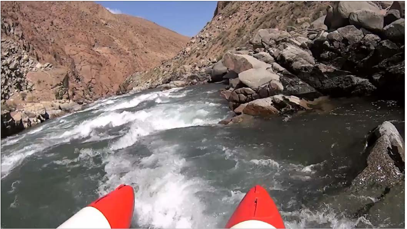
Кекемерен. Пор. Тура-Гоин 3. Кат-2/1. Начало порога.