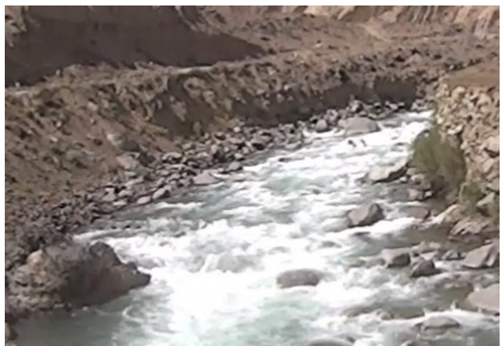
Кекемерен. Пор. Тура-Гоин 2. Прохождение кат-4 (виден в дальних сливае порог).