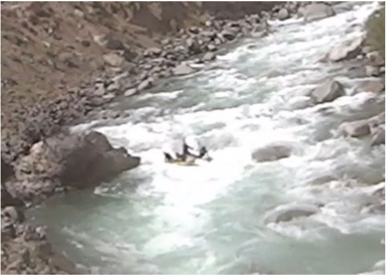
Кекемерен. Пор. Тура-Гоин 2. Прохождение кат-4 слива на переднем плане .