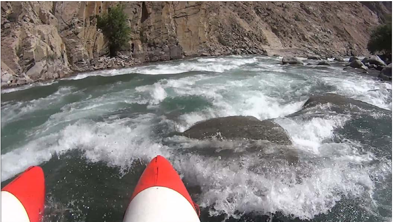
Кекемерен. Пор. Тура-Гоин 1. Кат-2/1. Лавировка внутри второй части порога.