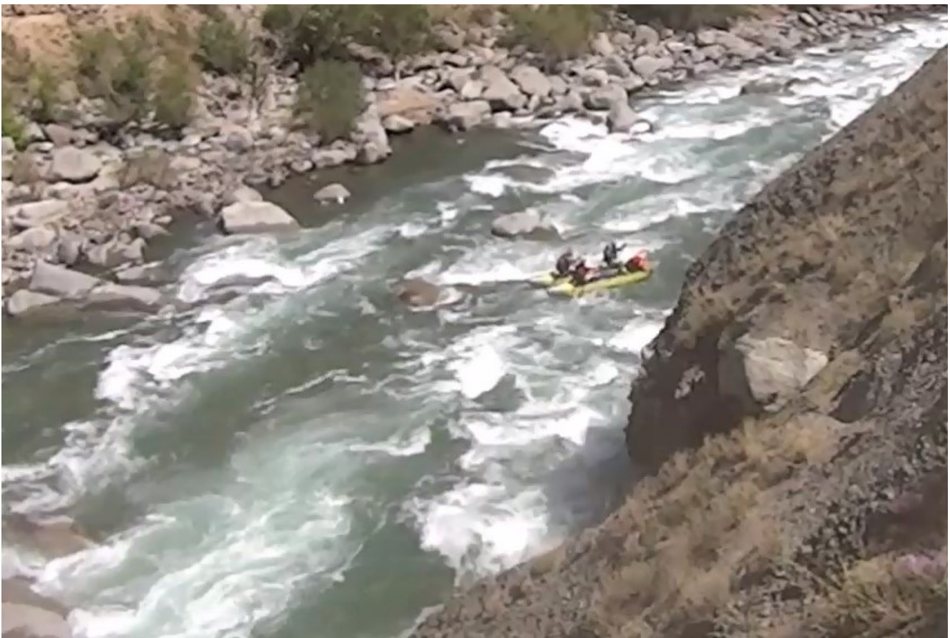
Кекемерен. Пор. Тура-Гоин 2. Кат-4 в заключительной трети порога.