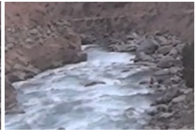
Кекемерен. Пор. Тура-Гоин 2. Кат-4. Долгая чалка для передышки..