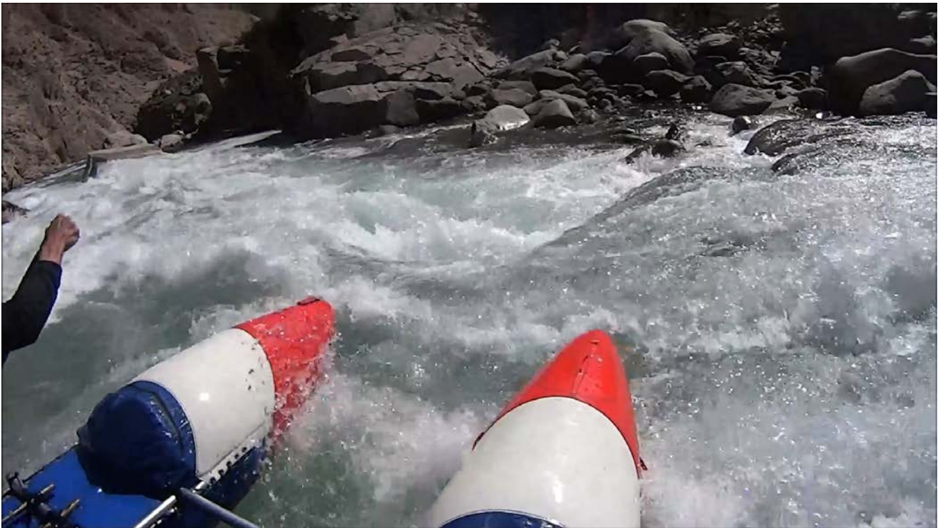
Кекемерен. Пор. Тура-Гоин 1. Кат-2/1. Пересечение основной струи. Впереди видна скала в середине струи.