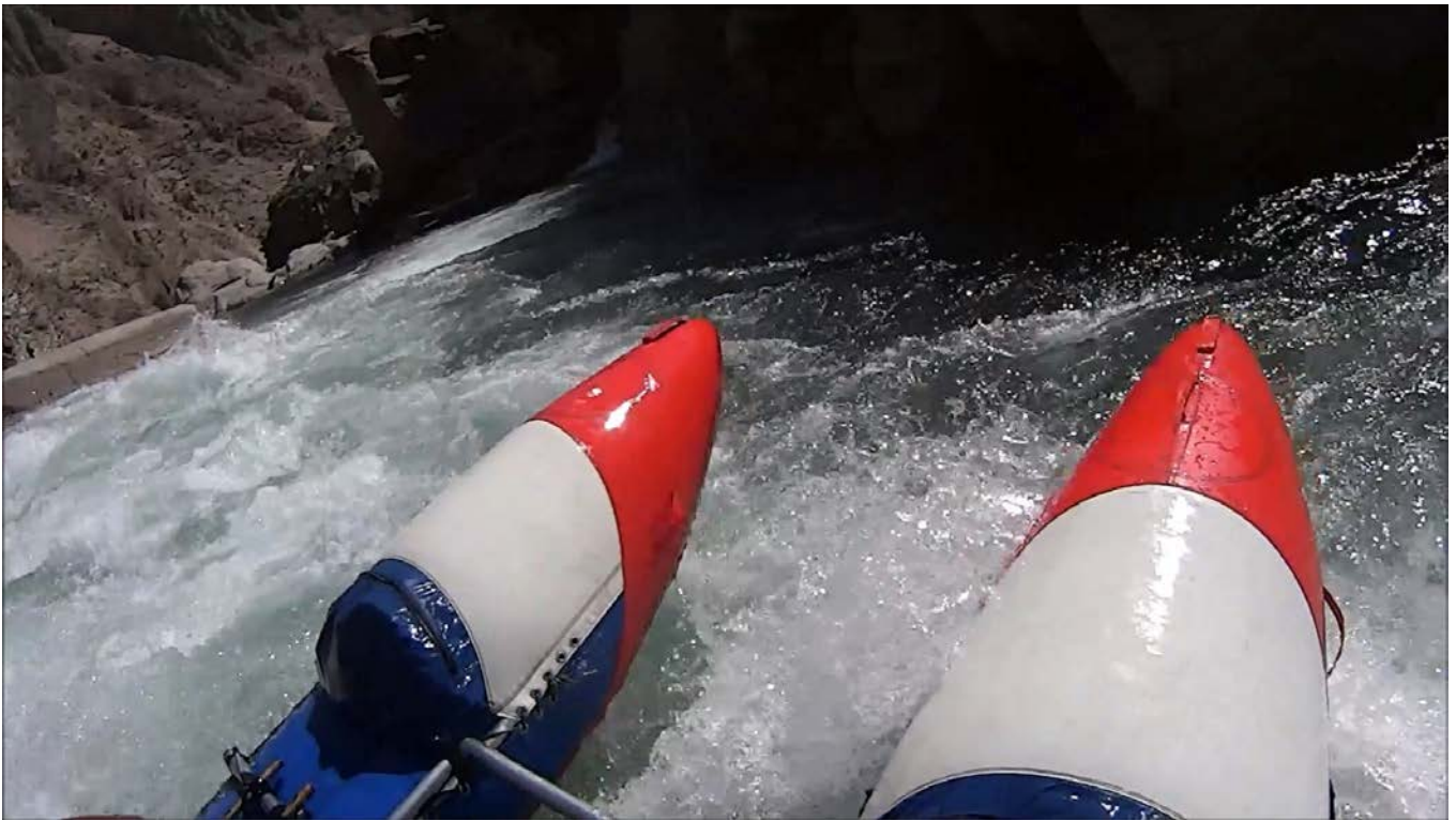
Кекемерен. Пор. Тура-Гоин 1. Кат-2/1 готов к сливу правее скалы в середине струи.