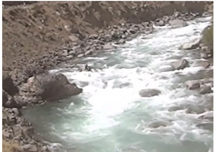
Кекемерен. Пор. Тура-Гоин 2. Прохождение кат-4 (слева в дальнем сливае, справа – на переднем плане).