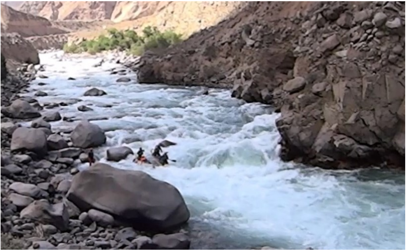
Кекемерен. Пор. Тура-Гоин 2. Кат-4 в заключительном сливе порога.